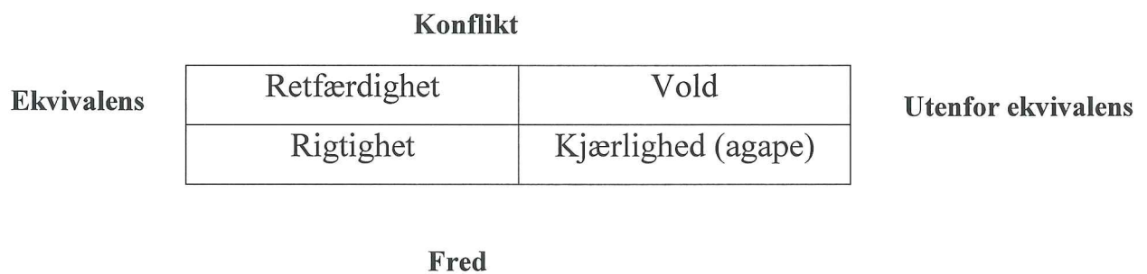
Figur 2 Fire handlingsregimer (Boltanski 2011, s.32)

«Det er menneskene selv, og deres kompetanse og miljø som skal studeres, ut fra menneskene eget språk om rettferd og sannhet. En sosiolog «må derfor opgive (om ikke andet for en stund) den kritiske indstilling for i det hele taget at kunne genkende de normative prinsipper, der ligger til grund for almindelige menneskers kritiske aktivitet» (Boltanski 2011, s.49).